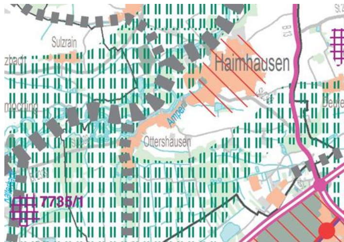
Abb. 4 Auszug Regionalplan mit Biotopverbundsystem und Regionalem Grünzug, Quelle: Regionalplan, Stand 04.08.2023

Das Plangebiet liegt im Außenbereich, am äußersten Siedlungsrand, dem die Regierung von Oberbayern eine noch angebundene Lage i.S.d. Ziels 3.3 des LEPs bestätigt. Im Vorentwurf war das Plangebiet als Grünfläche festgesetzt. „Im Sinne des Anbindungsgebots [...] wird es damit nicht zu einer geeigneten Siedlungsfläche für die Anbindung weiterer Siedlungsflächen“, stellt die Regierung in ihrer Stellungnahme zum Vorentwurf fest. Um dem Charakter einer Grünfläche nicht zu widersprechen, sind die geplanten Gebäude nun als Gemeinbedarfsfläche festgesetzt. Am Maß der Nutzung ergeben sich insoweit keine Änderungen, als dass nicht mehr Fläche als in der bisher dargestellten Grünfläche versiegelt werden darf. Im Gegenteil: die Zahl der Stellplätze wurde nach unten korrigiert. Insgesamt ist festzuhalten, dass Art und Maß der zulässigen Nutzung dem im Vorentwurf Zulässigen entsprechen. Weshalb sich allein durch die in der Signatur geänderte Nutzungsart kein Siedlungscharakter der Fläche ergibt. Sportstätten dieser Art müssen – ob als Grünfläche oder Gemeinbedarf – in Ortsrandlage möglich sein.