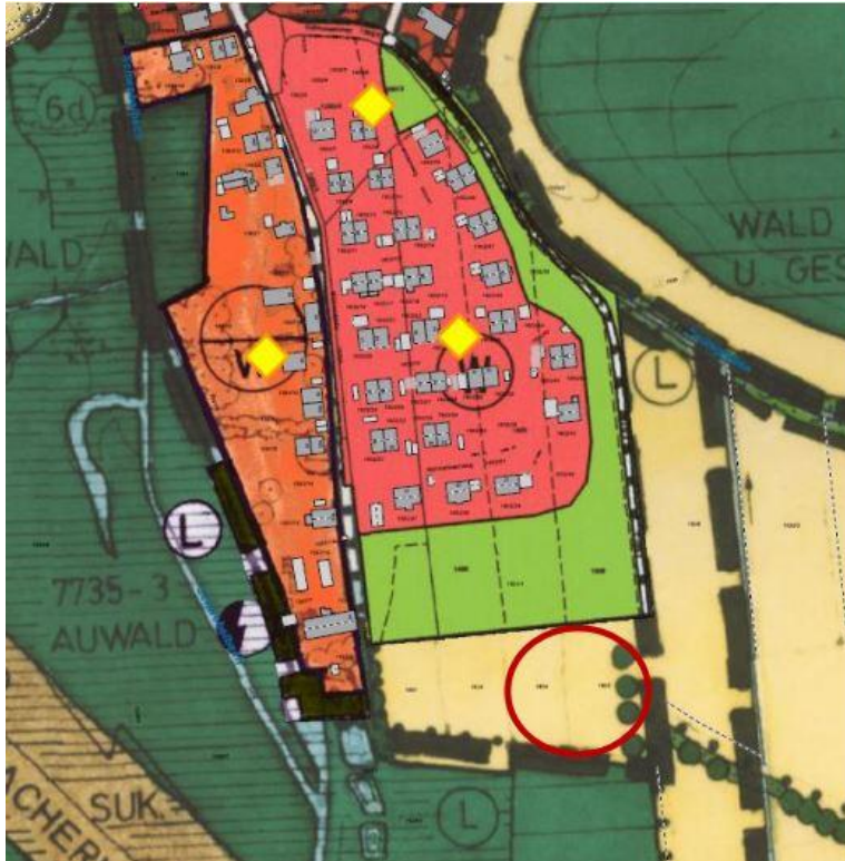
Abb. 6 Lage des Plangebiets im rechtswirksamen FNP inkl. der 9. Änderung, ohne Maßstab, Quelle RIWA-GIS.