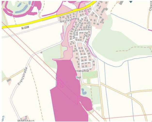
Abb. 2 Biotopkartierung, ohne Maßstab, Stand 04.08.2023

Der Regionale Grünzug und das Biotopverbundsystem überlagern den westlichen Siedlungsbereich Ottershausens und mithin auch den Geltungsbereich der vorliegenden Planung. Da nördlich des Geltungsbereichs Wohngebiete innerhalb von Grünzug und Biotopverbundsystem vorhanden sind, ist davon auszugehen, dass auch ein Bolzplatz (Grünfläche) mit untergeordneten Gemeinbedarfseinrichtungen (Vereinsheim und Lager) mit deren Zielen vereinbar sind.