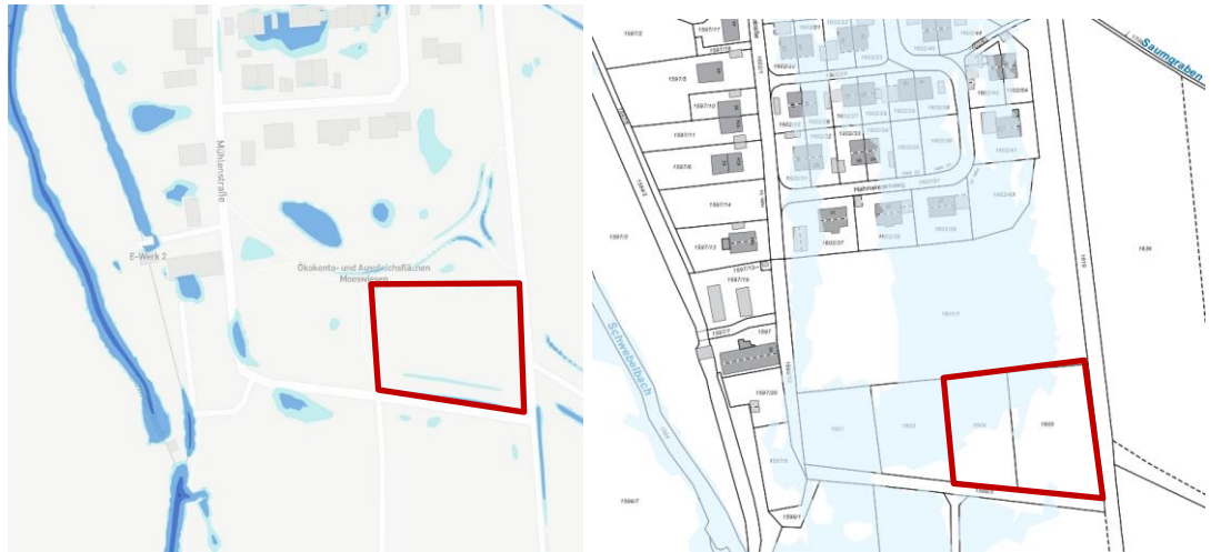
Abb. 3 Sturzflutrisiko, Quelle: Gemeinde Haimhausen. HQ_{\text{extrem}} , Quelle: RIWA Gis, ohne Maßstab

Im Geltungsbereich sind keine oberirdischen Gewässer, wassersensiblen Bereiche und Wasserschutzgebiete vorhanden. Jedoch liegt das Planungsgebiet in einer Hochwassergefahrenfläche HQ_{\text{extrem}} des Schwebelbachs (24.01.2014) und kann nach Berechnungen der Gemeinde in geringem Maß von einem Sturzflutrisiko (entlang des Mühlwegs) betroffen sein.