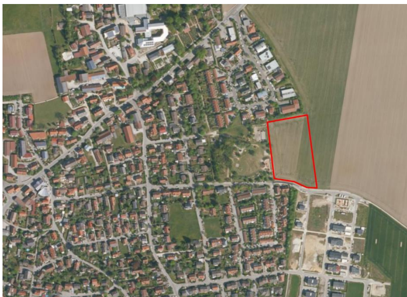
Abb. 1 Plangebiet, ohne Maßstab, Quelle: BayernAtlas, © Bayerische Vermessungsverwaltung, Stand 10.2022