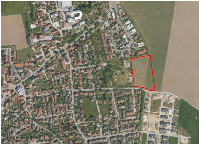
Abb. 1 Plangebiet, ohne Maßstab, Quelle: BayernAtlas, © Bayerische Vermessungsverwaltung, Stand 10.2022